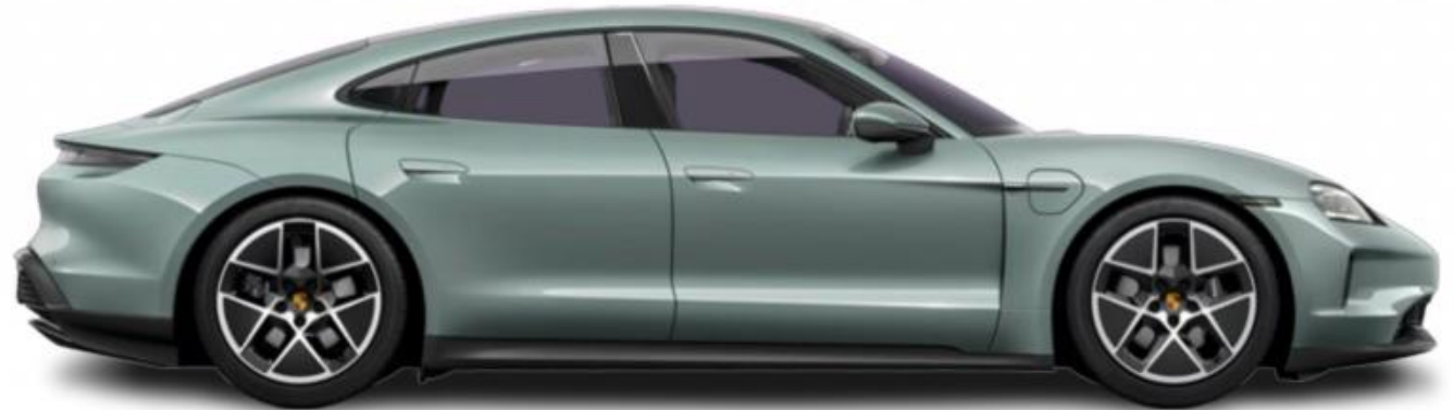
(Performancebatterie) Stromverbrauch kombiniert: 19,1 – 16,7 kWh/100 km, CO 2 -Emissionen kombiniert: 0 g/km, CO 2 -Klasse: A

Ein Angebot der Porsche Financial Services GmbH & Co. KG | Preisangaben inkl. MwSt. | Änderungen und Irrtümer vorbehalten