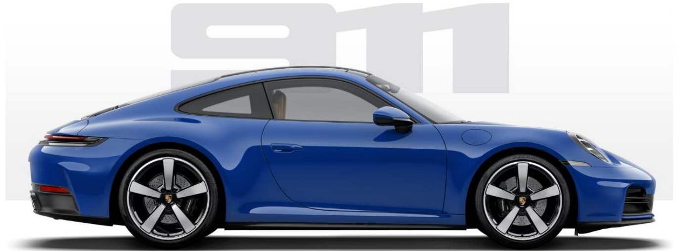
Kraftstoffverbrauch kombiniert: 10,5 – 9,9 l/100 km, CO 2 -Emissionen kombiniert: 238 – 226 g/km, CO 2 -Klasse: G

Ein Angebot der Porsche Financial Services GmbH & Co. KG | Preisangaben inkl. MwSt. | Änderungen und Irrtümer vorbehalten